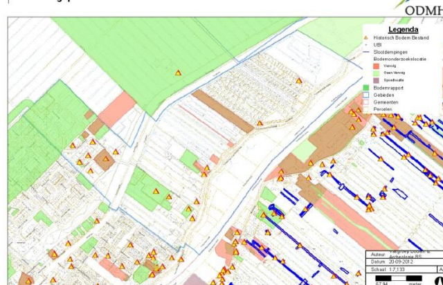
Bestemmingsplan Moordrecht-Buiten 2013

B&W nam geen moeite op onze brieven te reageren wat voor ons reden was een rappel te sturen en tegelijk onze zienswijze alsnog in te dienen. Onder het motto, wie zwijgt stemt toe. Ook dit leverde geen enkele reactie van de gemeente op, uitgezonderd de bekende bevestigingen van ontvangst.